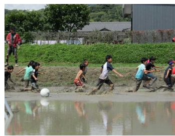
どろんこフェスタ