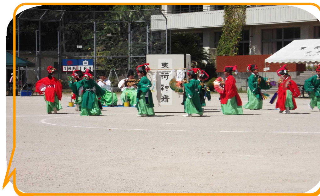
『2014. 9. 14…秋季大運動会にて東荷神舞披露』